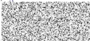
Mgr. Kamila Bláhová starostka města Litvínov