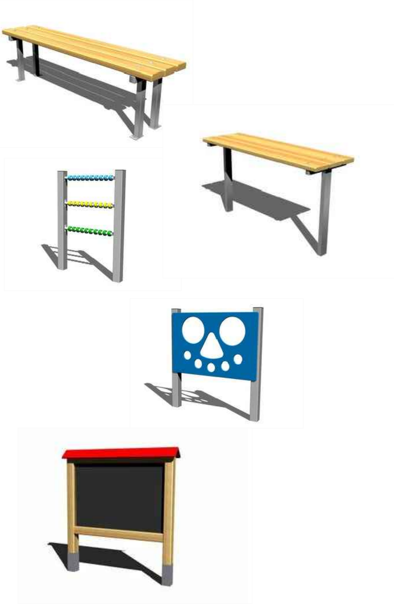
LEGENDA NAVRHOVANÝCH PLOCH A ČAR: