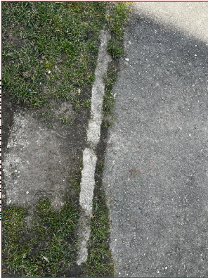
FOTO č. 3 betonové obrubníky