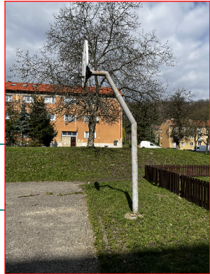
FOTO č. 1 konstrukce pro košíkovou