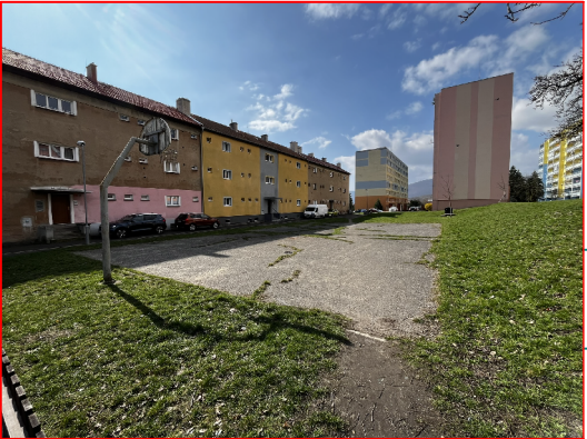
FOTO č. 4 asfaltová plocha