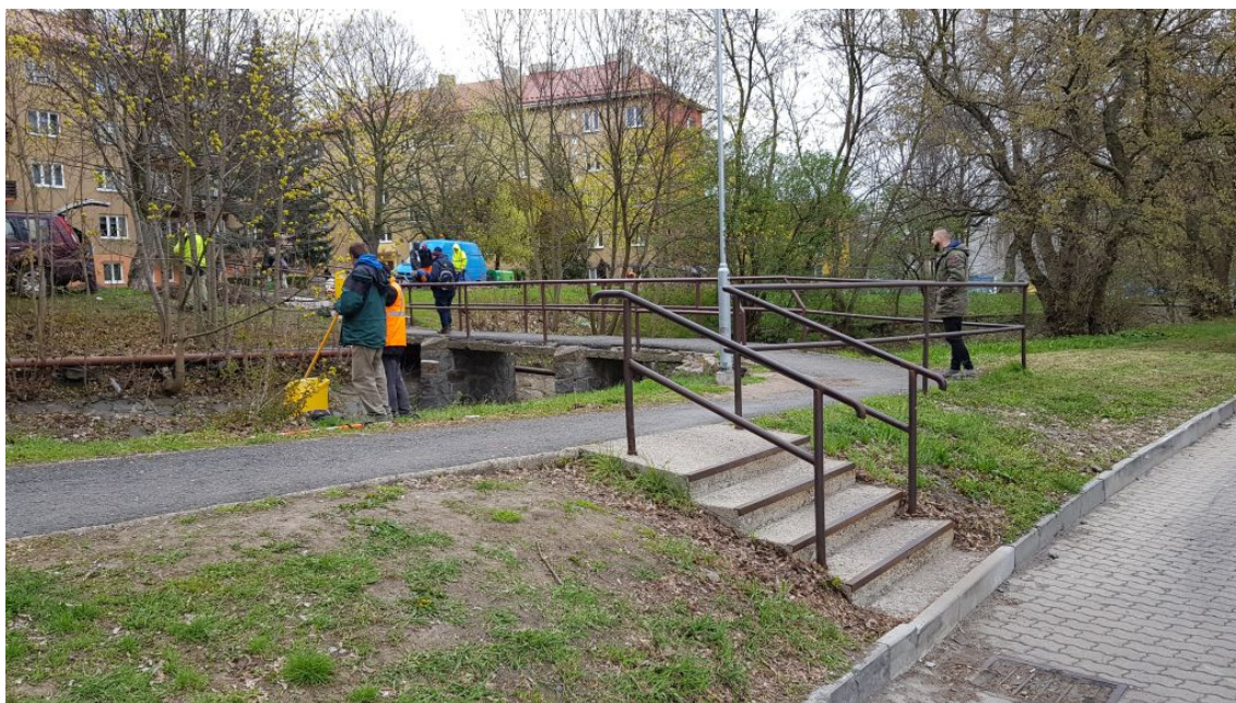
Obr.7-Pohled na lávku a přilehlé terénní schodiště od parkoviště u Penny marketu