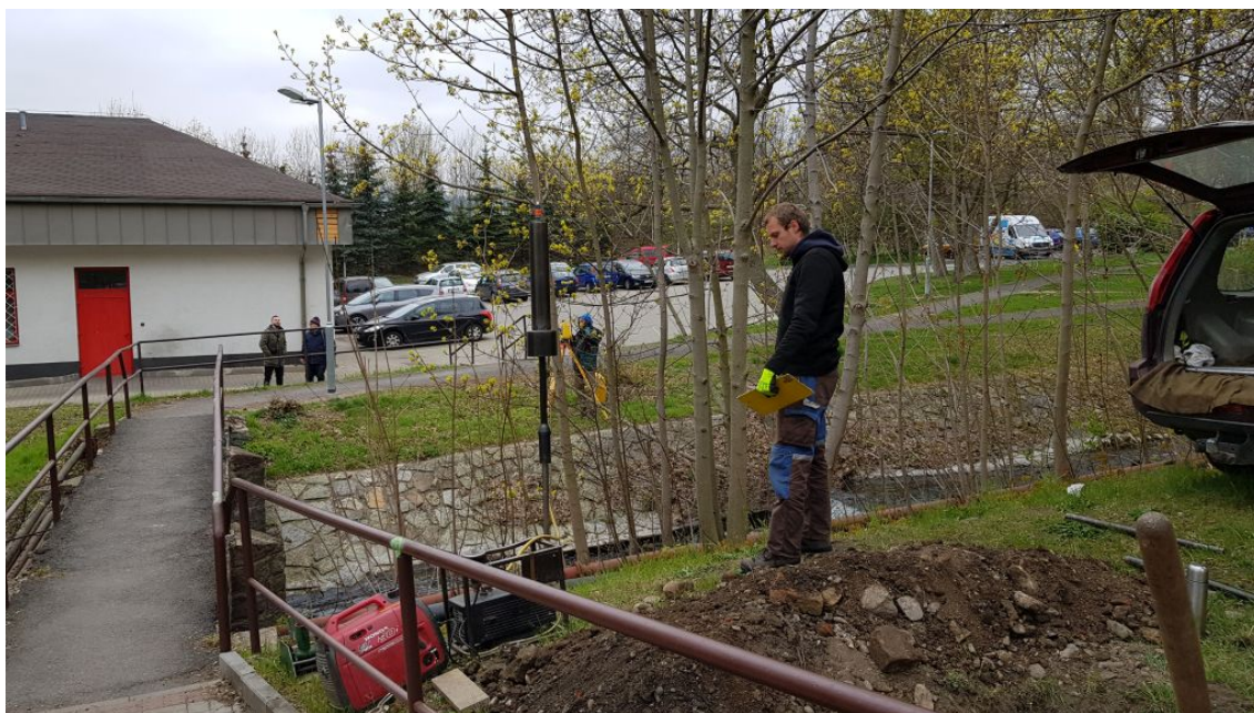
Obr.8-Pohled na lávku směrem ulice U Bílého sloupu (Penny) – sonda dynamické penetrace DP2