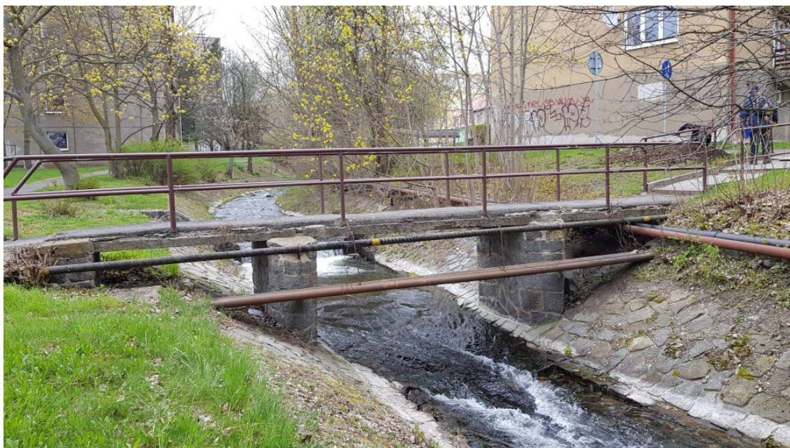
Obr.2-Pohled na lávku z výtokové strany