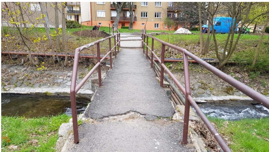
Obr.3-Pohled na lávku směrem ulice U Zámeckého parku