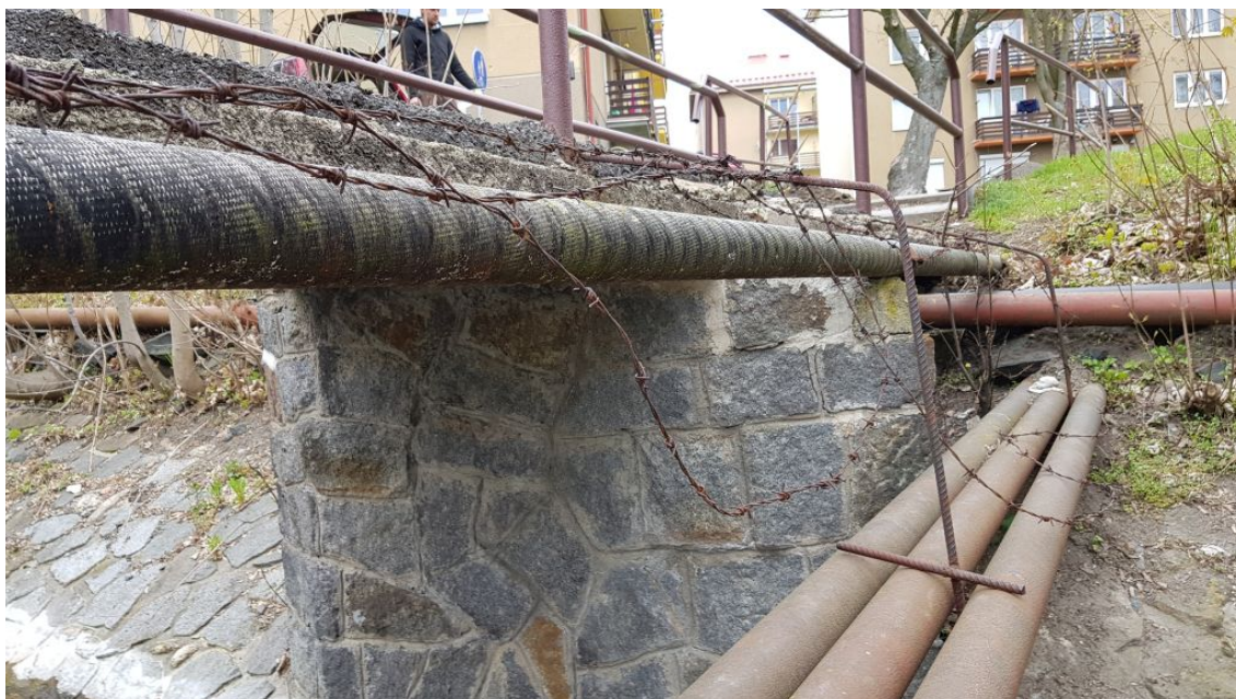
Obr.6-Pohled na lávku směrem ulice U Zámeckého parku – stávající inženýrské sítě