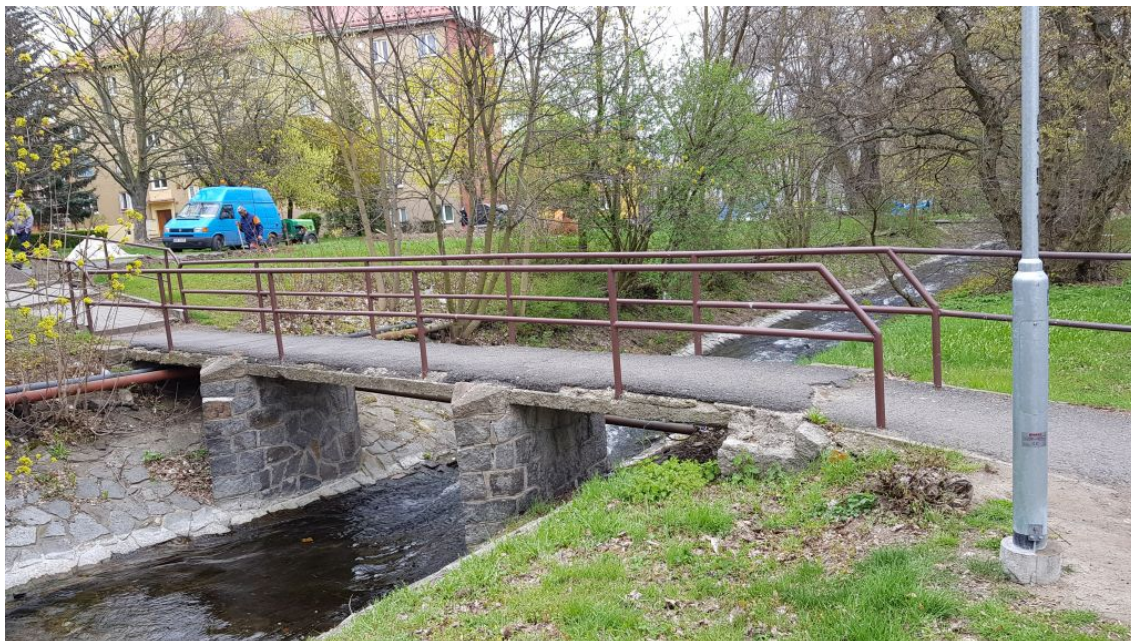
Obr.1-Pohled na lávku směrem z nátokové strany